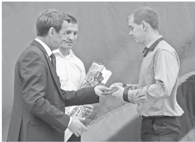
В канун профессионального праздника Дня Воздушного флота России на территории АО «Авиастар-СП» впервые была организована масштабная встреча почетных ветеранов предприятия с молодыми работниками под названием «Связь поколений».