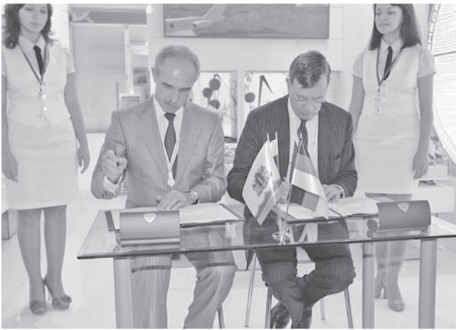
По итогам первого полугодия объем инвестиций в Ульяновской области составил 27,5 миллиарда рублей.