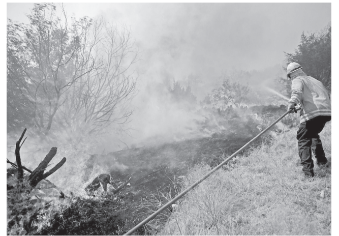
С начала года в регионе зарегистрировано 62 природных пожара на общей площади 84,76 га. В МЧС напоминают, что особый противопожарный режим на землях лесного фонда региона продлен до 31 августа 2015 года.