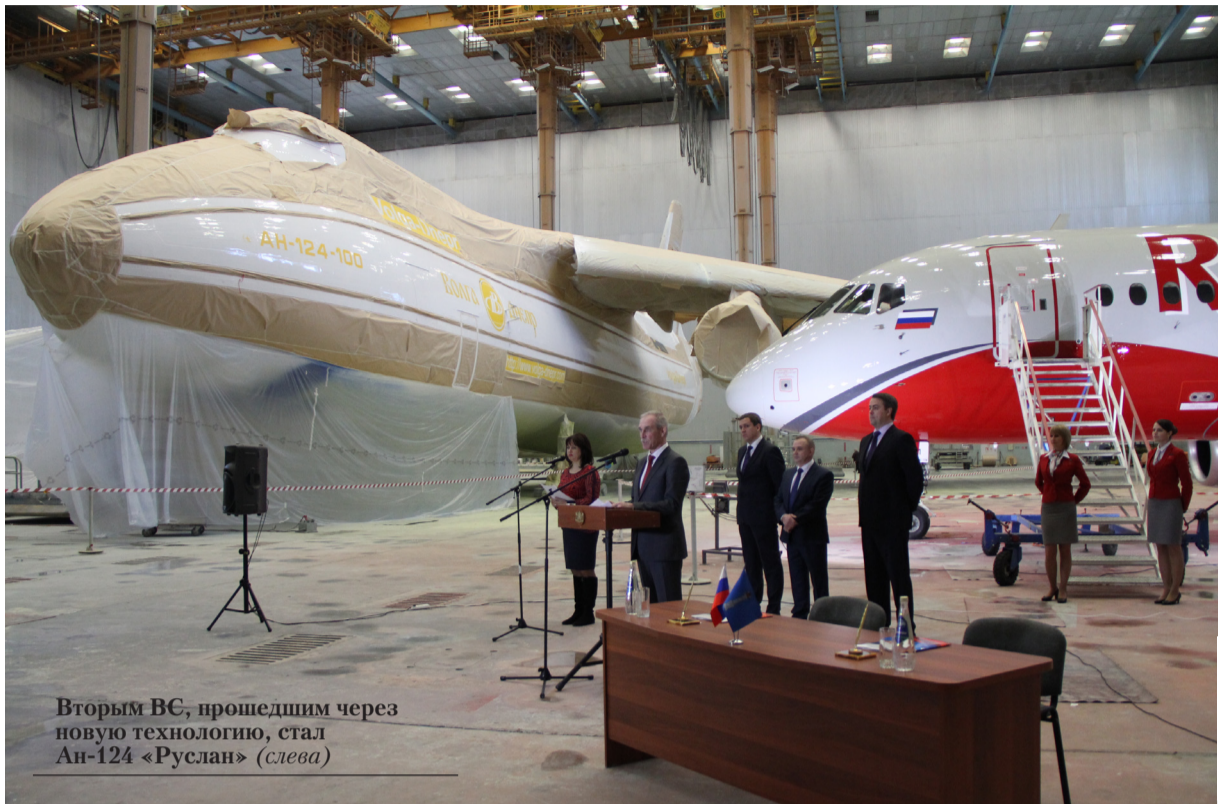
Вторым ВС, прошедшим через новую технологию, стал Ан-124 «Руслан» (слева)