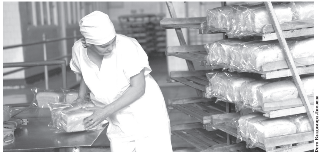
На хлебопекарных предприятиях региона работают больше 3000 ульяновцев

Засуха этого года не должна повлиять на формирование фонда, поскольку собранного урожая хватает для собственных нужд области. По данным на 13 августа, в Ульяновской области убрано чуть больше половины посевных площадей, на-