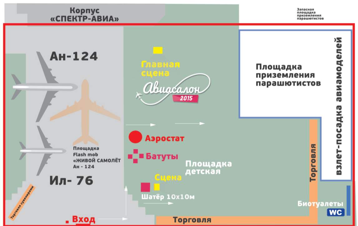
СХЕМА АВИАСАЛОНА 2015 аэропорт «Ульяновск-Восточный», Россия, Ульяновск

— Зона оцепления мероприятия — Зона оцепления